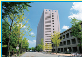
会場 総合研究棟 I 13 階