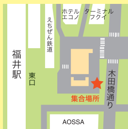
福井駅シャトルバス集合場所

福井駅発福井大学行き 9:25 集合場所 福井駅東口バス停留所 福井大学発福井駅行き 15:00 集合場所 大学事務局棟前