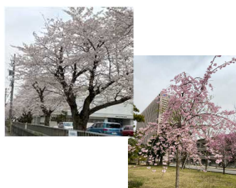
今年も文京キャンパス内の桜が咲き始め、優しいピンク色がコロナ禍に癒やしのひと時を与えてくれます。