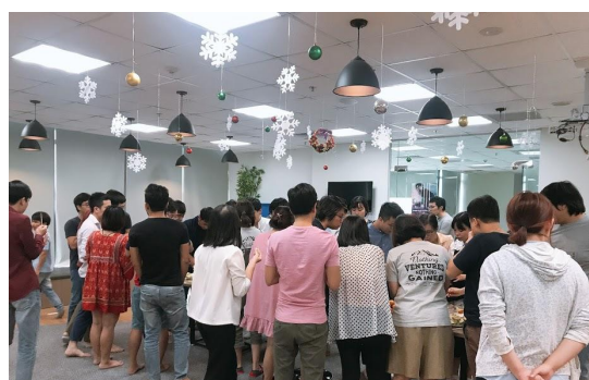
インターン先で、私のお疲れ様会をしていたのですが、食べ物メインです(笑)