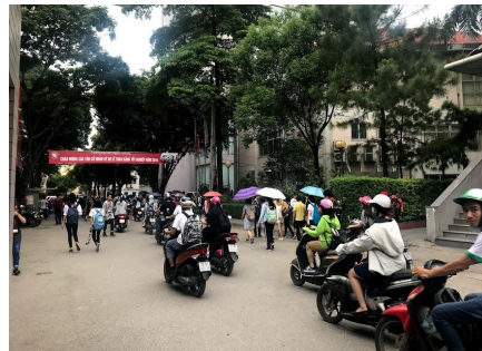
校内でも事故に注意しましょう