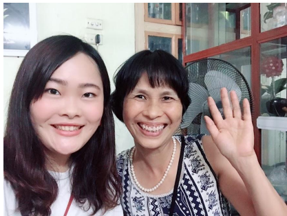
大家さんとお別れ写真

最後に治安がいいかも気になるポイントだと思います。ハノイの治安は比較的にいい方で危ない目に遭ったことは基本的にありませんでした。夜中は避けた方がいいですが、夜も女性一人で歩けます。ひたたくりやすりも多いと言われますが気を付けていれば被害に遭うことはないと思います。ただ、ベトナムの文化で誰に対しても年齢や職業、恋人の有無を聞く風潮があるのでそこは少し気を付けた方がいいかもしれません。バイクタクシーを利用した際にドライバーからそのような質問をされ、後日携帯にメッセージがくることもあったので、私は違う大学に通っていると嘘をついたり、家の前で降りるのではなく少し手前で降りたりしていました。