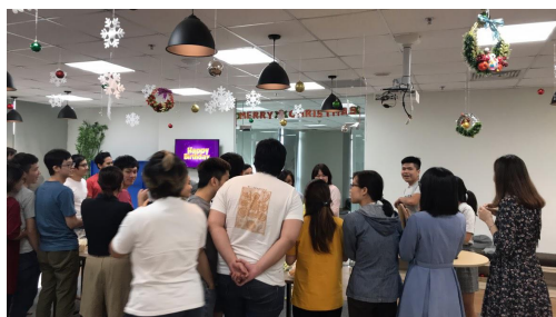
月 1 の誕生日パーティー

社員のほとんどがベトナム人で日本人は 4 人しかいませんが、英語でコミュニケーションを取れますし、日本語が話せる人も数人いてとても楽しく仕事をしています。日本の会社とは違って、自由で解放された雰囲気があります。正直なところ、大学での授業があまり好きではないので、ここでの仕事が楽しいです（笑）上司も本当にいい方で、仕事以外にも私が興味があることややってみたいことを話すと、他企業との打ち合わせに参加させてくれたり、仕事以外で知り合いの人につなげてくれたりと様々な機会を与えてくれています。たった 2 ヶ月のアルバイトですが、想像以上に大きい成果が得られそうです！