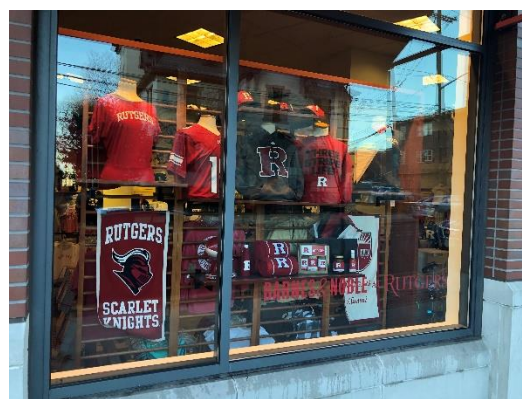
ラトガースのショップです。ラトガース関連の商品がとてもたくさん並んでいます

以前の報告書でも既述したようにラトガース大学のキャンパスは非常に広いです。また授業の数も福井大学とは比べ物にならないほどあります。いまのところ日本で見られるように友達と履修を合わせて一緒に授業に行くということはないですし、現地の学生でもそのような姿は見たことがありません。現地に到着して数日すると、留学生向けの交流会などが開かれていろいろな人と話すことができますが、なにせ各々専門は違い、履修も異なってくるのでそこから交友を深める機会があまりないのかな、と感じています。